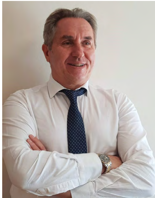
ΝΙΚΟΛΑΟΣ Δ. ΦΙΛΙΠΠΑΣ, ΚΑΘΗΓΗΤΗΣ ΧΡΗΜΑΤΟΟΙΚΟΝΟΜΙΚΗΣ ΤΟΥ ΠΑΝΕΠΙΣΤΗΜΙΟΥ ΠΕΙΡΑΙΩΣ, ΠΡΟΕΔΡΟΣ ΚΑΙ ΙΔΡΥΤΗΣ ΤΟΥ ΙΝΣΤΙΤΟΥΤΟΥ ΧΡΗΜΑΤΟΟΙΚΟΝΟΜΙΚΟΥ ΑΛΦΑΒΗΤΙΣΜΟΥ DATE: 10/02/2024

Στο άρθρο αυτό παρουσιάζουμε τα οφέλη της αποταμίευσης, τόσο σε μακρο-επίπεδο όσο και σε