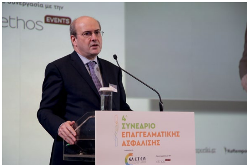
Στο θήμα ο Κωστής Χατζηδάκης, εκπρόσωπος του Προέδρου της Ελληνικής Κυβέρνησης, υπουργός Εργασίας και Κοινωνικών Υποθέσεων.

Είναι πολύ αισιόδοξο το αυξημένο, πλέον, ενδιαφέρον των διοικήσεων των εργοδοτριών εταιρειών να δημιουργήσουν επαγγελματικά ταμεία, εντάσσοντας την ενέργεια αυτή στη συνολική στρατηγική διαχείρισης του ανθρώπινου δυναμικού τους, για την ενίσχυση των εργαζομένων τους.