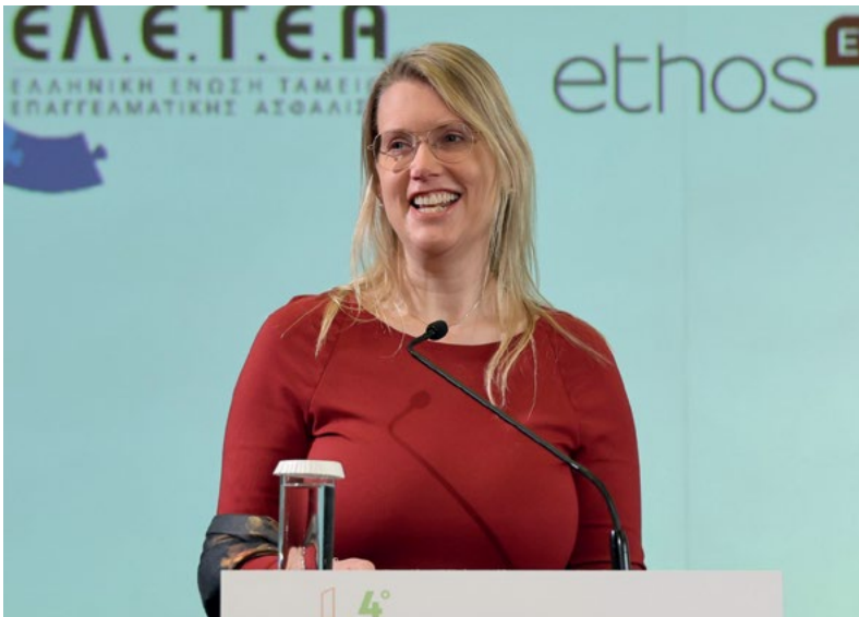
Κεντρική ομιλήτρια του συνεδρίου ήταν η Petra Hielkema, Chairperson, European Insurance and Occupational Pensions Authority (ΕΙΟΠΑ), με θέμα ομιλίας "Demystifying pensions" (Απομυθοποιώντας τις συντάξεις).