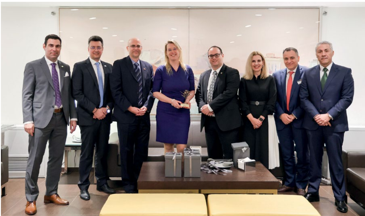
Η επίσκεψη της προέδρου της Ευρωπαϊκής Εποπτικής Αρχής Ασφαλίσεων και Επαγγελματικών Συντάξεων (European Insurance and Occupational Pensions Authority-ΕΙΟΡΑ), Petra Hielkema, ολοκληρώθηκε με ένα επίσημο δείπνο με φόντο την Ακρόπολη και με αναμνηστικά δώρα που της έδωσαν οι διοργανωτές.