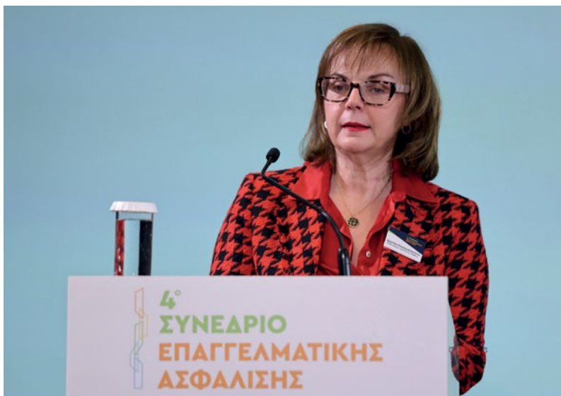
Η Χριστίνα Παπακωνσταντίνου, υποδιοικήτρια της Τράπεζας της Ελλάδος, αναφέρθηκε στις θετικές επιπτώσεις που θα μπορούσε να έχει μια μεταρρύθμιση η οποία θα επέτρεπε τα πολυεργοδοτικά TEA.

ανά επιχείρηση είναι περίπου 33% χαμηλότερος από τον αντίστοιχο στην ΕΕ. Επίσης, το ποσοστό των αυτοαπασχολημένων στο σύνολο των απασχολημένων στη χώρα μας είναι διπλάσιο από αυτό της ΕΕ.