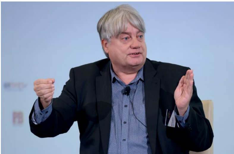
Ο Henk Becquaert, Member of the Management Committee, FSMA (Εποπτική Αρχή ΙΕΣΠ Βελγίου).

ποιοιμένα, ενώ οι περισσότερες εταιρείες και διαχειριστές έχουν αυτό υπόψη τους. Εμείς δημιουργήσαμε ένα πλαίσιο για τους κινδύνους που ξεκαθαρίζει τι ακριβώς πρέπει να γίνεται για να υπάρχει αξιολόγηση κινδύνου. Υπάρχει ένας κατάλογος διαδικασιών που πρέπει να ακολουθηθούν. Θα προσαρμοστούμε στους νέους κανονισμούς, ώστε όλα να είναι ξεκάθαρα».